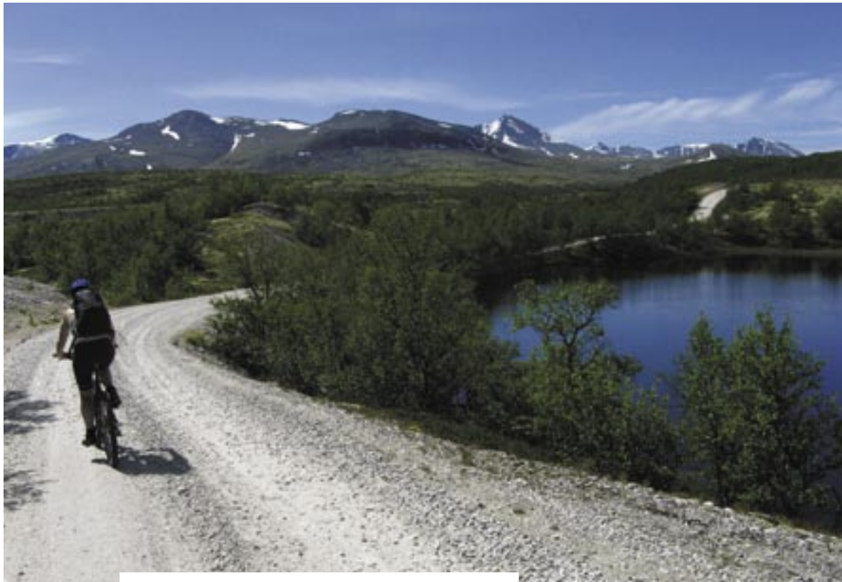
RONDANE PANORAMA: fra bakkene opp mot Breisjøseter ser du rett inn i motivet som inspirerte til Norges nasjonal-maleri: «Vinternatt i Rondane».