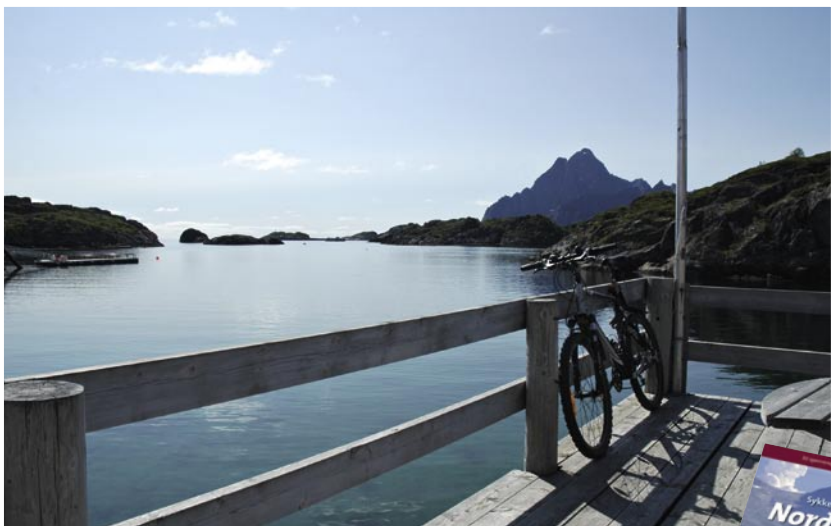
◀ VÅGAN. Utsikt fra Vågan mot Vågakallen (942 m).

polarsirkelen, og på Brurberget ble tinget i Hålogaland holdt fram til tidlig middelalder. I Storvågan finnes tufter etter bebyggelse fra middelalderen. Besøk Lofotmuseet www.lofotmuseet.no som er bygd opp rundt den gamle væreiergården fra 1815. Her kan du se framveksten av tørrfiskeeksporten i middelalderen samt gamle rorbuer og naust med Nordlandsbåter. Like bortenfor ligger Galleri Espolin som presenterer en unik billedsamling av Kaare Espolin Johnson, og Lofotakvariet www.lofotakvariet.no med et storfiskbasseng og populære sel- og oterdammer. På turist- og rorbuanlegget Nyvågar Rorbuhotell www.nyvagar.no er det overnatting og servering.