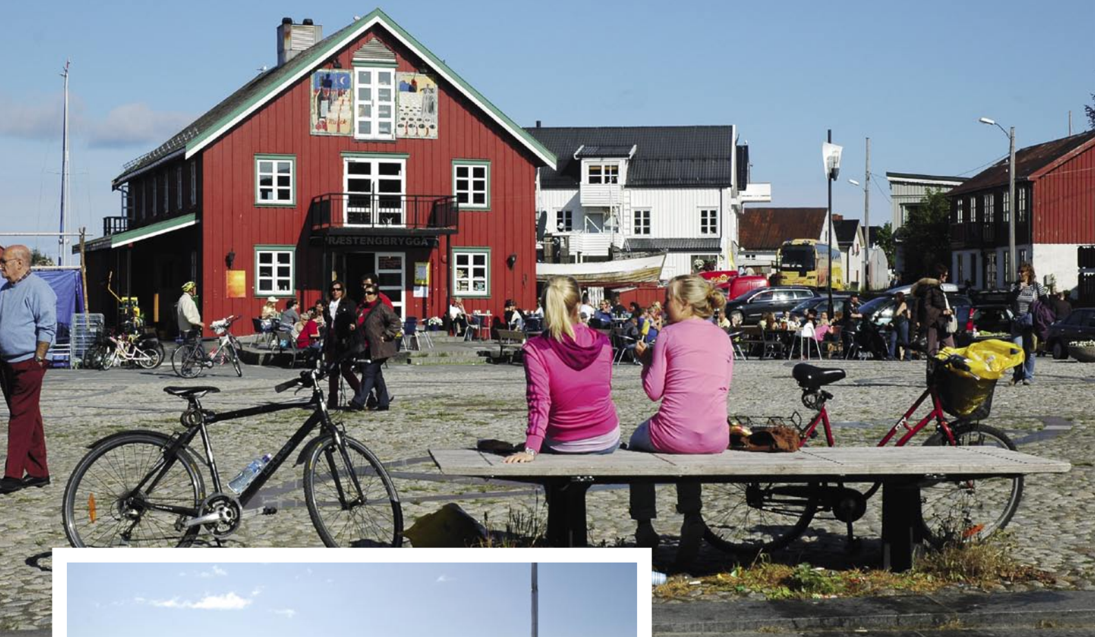
▲ SLAPPE AV. På torget ved Præstengbrygga i Kabelvåg er det uteservering.